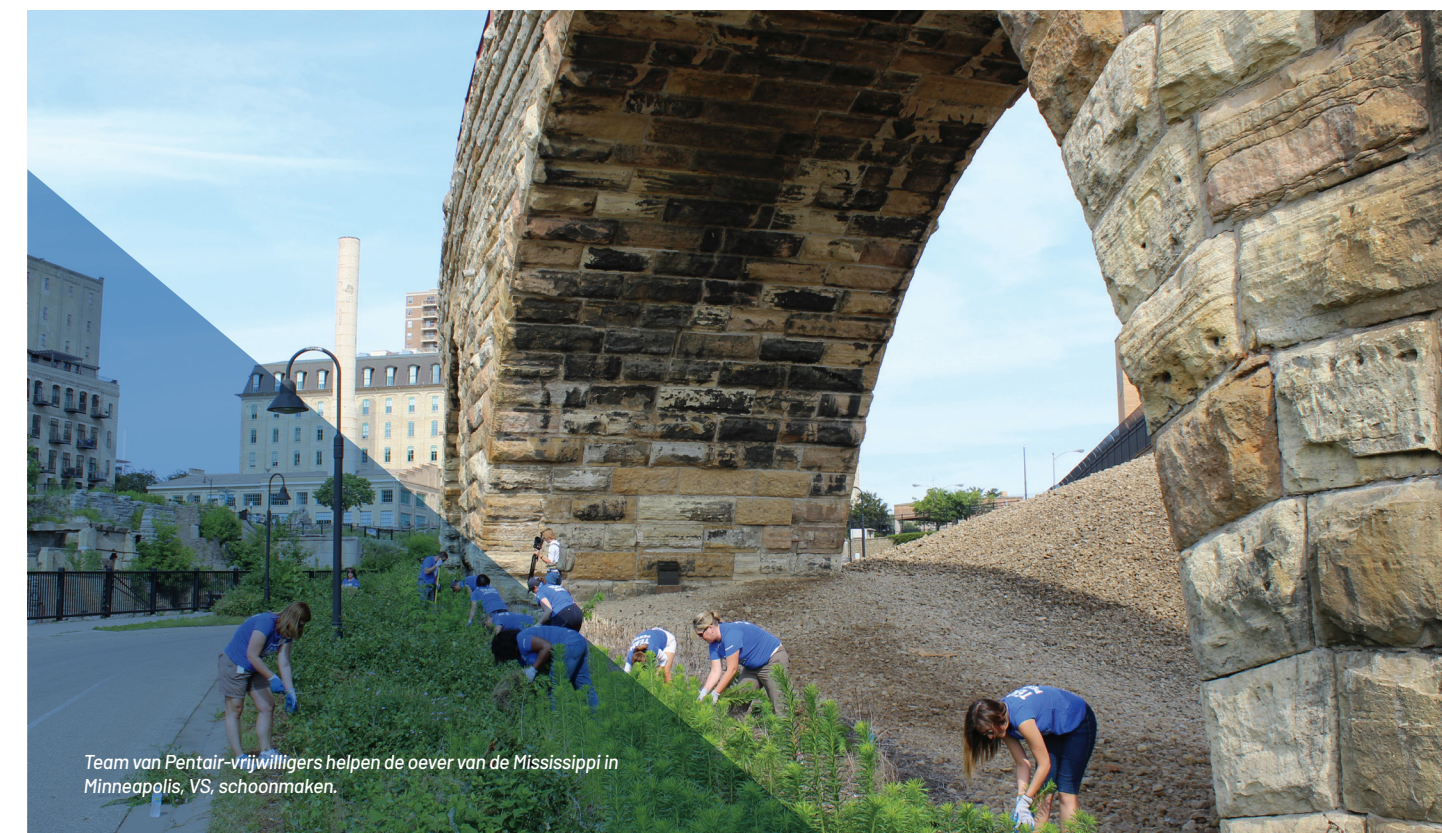
Team van Pentair-vrijwilligers helpen de oever van de Mississippi in Minneapolis, VS, schoonmaken.

Een vrijstelling van de Code voor leidinggevend en of directeurs mag alleen worden gegeven door de raad van bestuur van Pentair of door de bestuurscommissie van de raad.