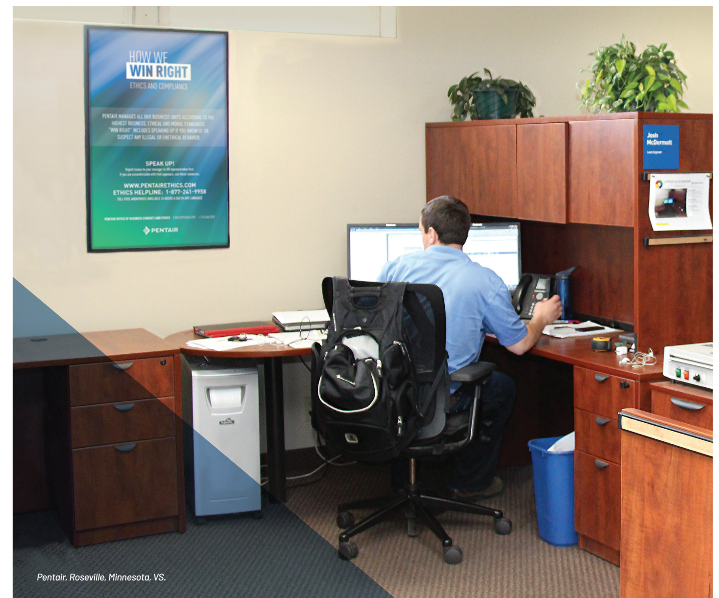
Pentair, Roseville, Minnesota, VS.

A: Pentair neemt aantijgingen van vergelding zeer ernstig. Dit betekent dat we onze werknemers en managers opleiden over wat vergelding inhoudt en ervoor zorgen dat ze begrijpen wat de gevolgen ervan zijn. Als een aantijging van vergelding bewezen wordt, dan zal het bedrijf de betrokken personen straffen, met inbegrip van ontslag.