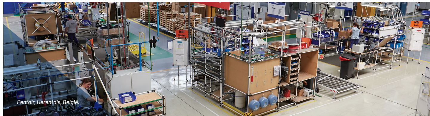
Pentair, Herentals, België

Pentair onderzoekt alle incidenten, verwondingen en bijna-ongevallen met het doel permanente corrigerende maatregelen te nemen en de onderliggende oorzaak te elimineren.